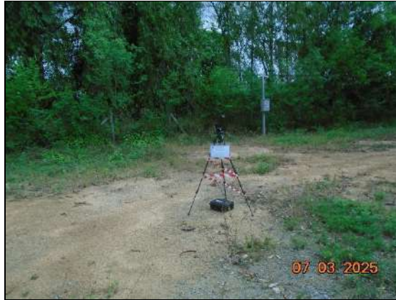
ติดตั้งวัดโรงงานทางด้านทิศเหนือ