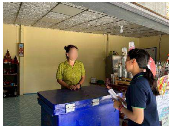
รูปที่ 3.5-2 การสำรวจสภาพเศรษฐกิจ-สังคมความคิดเห็น