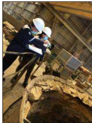
ภาพที่ 20(ต่อ) แพทย์อาชีวเวชศาสตร์ประเมินสภาพแวดล้อมในการทำงาน รูปที่ 3.1-1 การปฏิบัติตามมาตรการป้องกันและลดผลกระทบสิ่งแวดล้อม