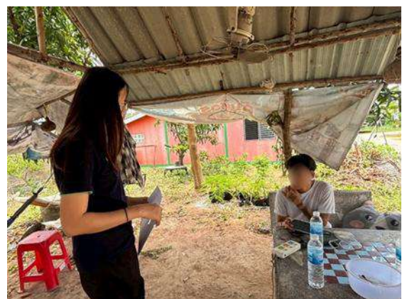
รูปที่ 3.5-2 (ต่อ) การสำรวจสภาพเศรษฐกิจ-สังคมความคิดเห็น