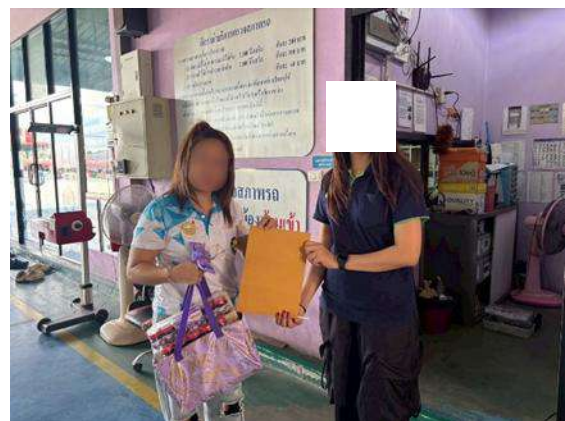
รูปที่ 3.5-2 (ต่อ) การสำรวจสภาพเศรษฐกิจ-สังคมความคิดเห็น