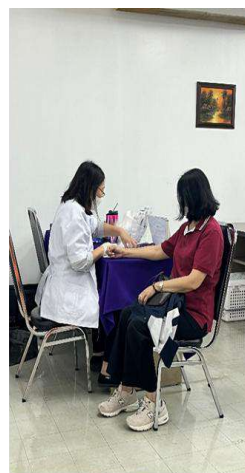
ภาพที่ 21 (ต่อ) การตรวจสุขภาพพนักงานประจำปี เดือนกันยายนและเดือนตุลาคม 2567