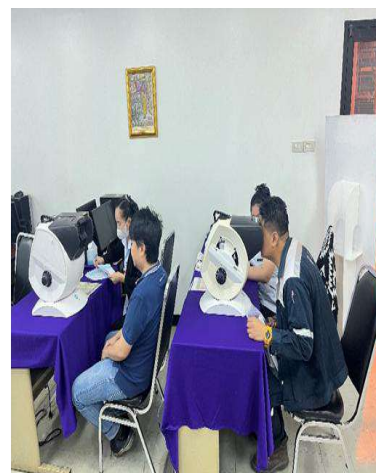
ภาพที่ 21 การตรวจสอบสภาพพนักงานประจำปี เดือนกันยายนและเดือนตุลาคม 2567